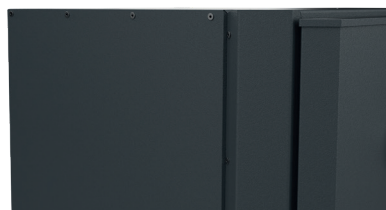
FINITION RIVETÉE SPÉCIALE « ACIER GALVANISÉ ANTI-ROUILLE »